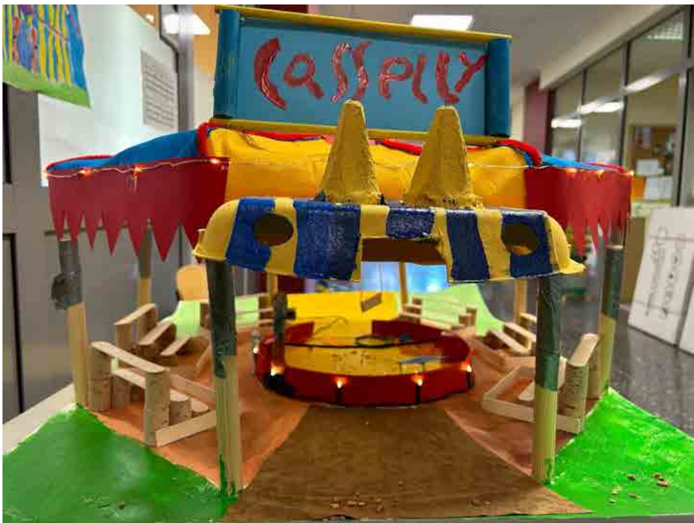
Objekt „Zirkus Cassely“ – Schildkrötenklasse 4d – November 2023