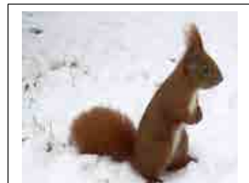
Eichhörnchen im Schnee Dellex

Das Eichhörnchen springt flink von einem Baum zum anderen. Es läuft bis zur Astspitze, holt Schwung und springt durch die Luft. Drei Meter mit einem einzigen Sprung. Bravo! Während des Sprunges lenkt es mit dem Schwanz. Bei der Landung bremst es damit wie mit einem Fallschirm. Für Eichhörnchen ist ihr Schwanz so wichtig, dass sie besonders gut aufpassen, um ihn nicht zu verletzen.